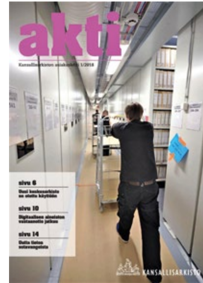
Aineistojen sijoittamista Kansallisarkiston Mikkelin keskusarkistoon. Akti 1/2018.

Massadigitoinnissa kehitettyjä prosesseja on tärkeää soveltaa myös Kansallisarkistossa jo säilytettävän aineiston takautuvaan digitointiin. Tavoitteena on, että Suomen historian eri aikakausien aineistot ovat lopulta kaikkien helposti käytettävissä digitaaliossa muodossa. Se vähentää tarvetta