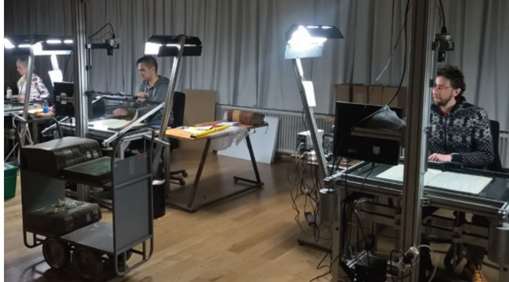
Vapaaehtoisdigitointia Kansallisarkistossa.

Arkistolain uudistamisessa keskeistä on määrittellä tiedonhallinnan ohjaussuhteet ja määräysvallan rajat sekä taata Kansallisarkistolle kansainvälisen mallin mukaisesti