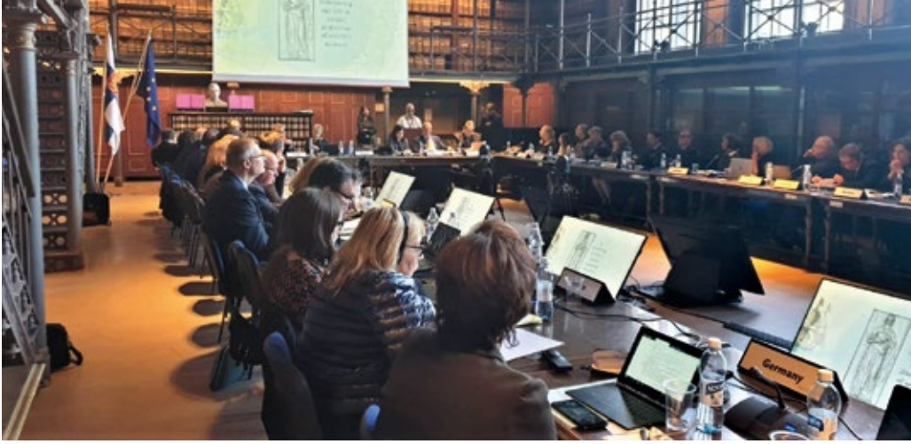
Suomen EU-puheenjohtajakauden arkistonjohtajien EBNA-kokous syyskuussa 2019.

ja yhteiset toimintarakenteet ovat lisänneet osallistumista ja osaamisen jakamista. Euroopan komission perustama asian tuntijaryhmä, European Archives Group, ja EU:n jäsenmaiden pääjohtajat tapaavat kahdesti vuodessa yhteisessä foorumissa, joka suuntaa yhteistyötä. Osa yhteistyötä toteutuu muissa yhteenliittymissä, kuten DLM-Forumissa, joka on vahvasti suuntautunut edistämään yhteisten eurooppalaisten ratkaisujen löytämistä digitaaliseen pitkäaikais säilytykseen ja arkistointiin.