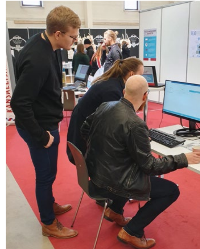
READ-hankkeen esittely Turun kirjamessuilla lokakuussa 2019.