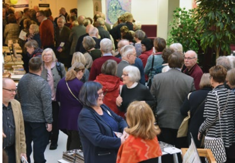
Sukututkimustapahtuma veti väkeä Tampereelle maaliskuussa 2018.

Yhtenä tulevaisuuden tavoitteena on se, että sukututkijoiden oman tutkimustyön tulok-