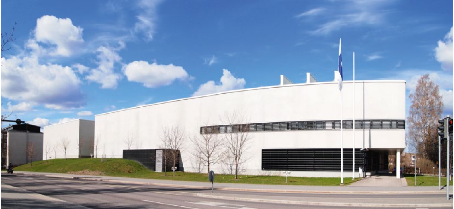
Kansallisarkiston Jyväskylän toimipaikka.

huolehdittava siitä, että nykyinen aineisto-osaaminen säilyy ja että perinteiselläkin historian tutkimuksella on nyt ja myös tulevaisuudessa tärkeä paikka suomalaisessa tiedemaailmassa. Vanhoja käsialoja pitää yhä opiskella ja suuri osa etenkin varhaisempien aikojen aineistoista on edelleen käytettävissä vain paperiversioina – ja